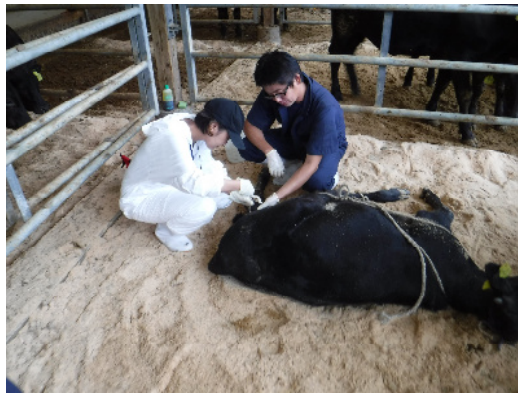
家畜診療体験研修