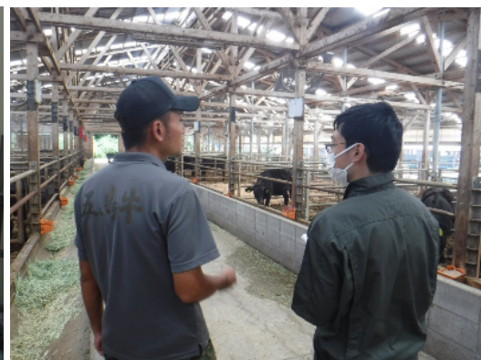
キャトルセンターの見学