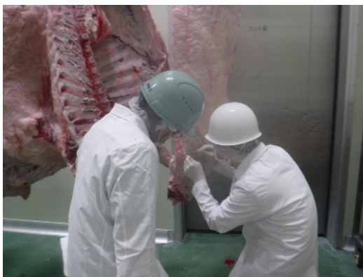
食肉検査所の見学