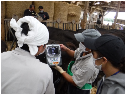
胎子をエコーで確認