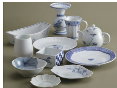
受け継がれた伝統の技を生かして、現在のライフスタイルにも合うやきものづくりが行われている。

地域の歴史的的魅力や特色を通じて我が国の文化・伝統を語るストーリーを「日本遺産 (Japan Heritage)」として文化庁が認定するもの