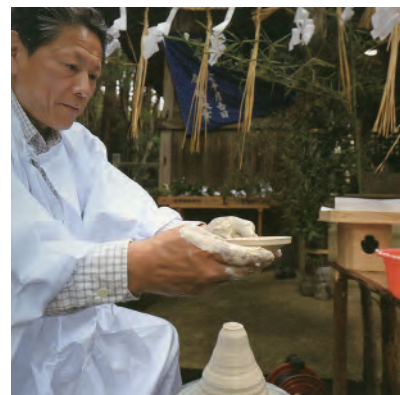
やきものを焼く時に使う道具「はまぜん」を供養する神事の様子。窯元巡りも楽しめる「はまぜんまつり」は、毎年5月1～5日に開催される。